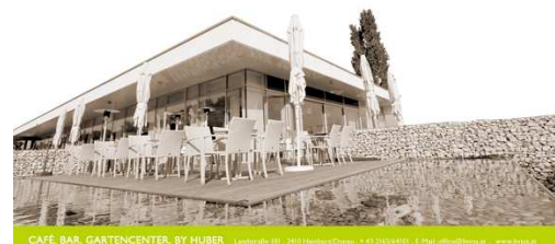
CAFÉ BAR GARTENCENTER BY HUBER

LIVIOS CAFÉ.RESTAURANT by HUBER Landstrasse 181, 2410 Hainburg, Tel.: 02165/64101 22 www.livios.at